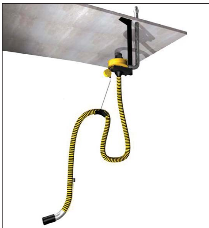
FEF com extens o de montagem PA-110